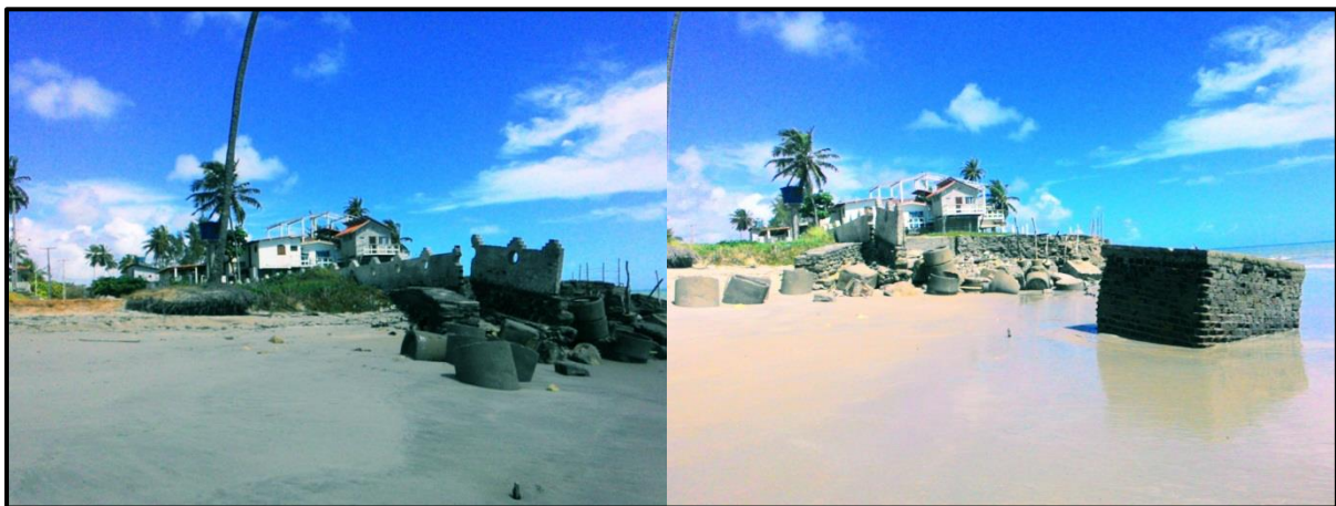
Figura 5. Erosão costeira no município de Pitimbu, litoral sul da Paraíba.

Outra situação mais próxima de nossa realidade foi o que aconteceu na área do estado de Pernambuco, no Porto de Suape, nas instalações das atividades portuárias e industriais, as quais proporcionaram o assoreamento do manguezal do rio Tabatinga, que foi impactado, devido ao aterramento realizado para a pavimentação da Rodovia TDR-Norte, a qual dá acesso ao porto (CIDREIRA, 2014). E esse efeito pode estar ocasionando efeitos diretos ou indiretos na costa paraibana, na cidade de Pitimbu (Fig. 5).