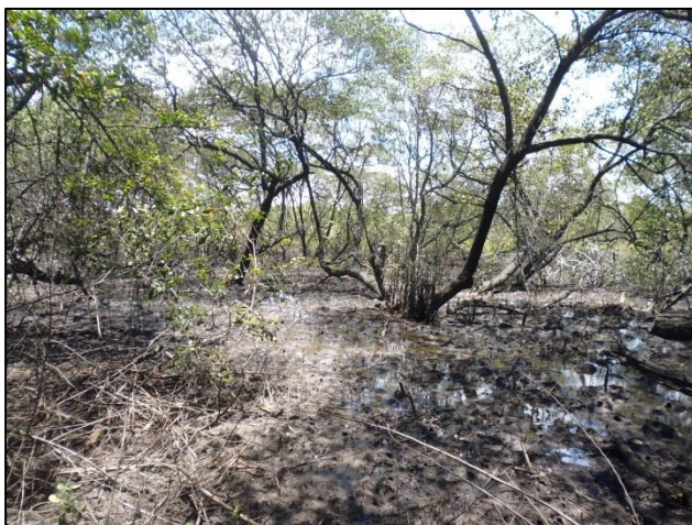
Figura 2. Processo de aterramento de uma área, localizado nas proximidades do estuário do rio Goiana, no município de Caaporã, estado da Paraíba.

que existe em grande quantidade em nossa região, pois as águas já não conseguem mais adentrar e atingir os locais outrora reservados a ela. Os grandes bancos de areia, que estão se formando rapidamente na foz do rio com o mar, e com grande frequência forma uma barreira, impedindo que a água oriunda do mar tenha um acesso rápido ao seu destino final (a montante do rio), pois é necessário que o mar atinja uma altura de lâmina significativa e inicie o seu fluxo em direção rio a cima. Isto tem proporcionado um atraso considerável na hora da enchente da maré, fazendo com que áreas que deveria ficar alagadas não fiquem mais, porque a água não atinge ao seu destino final, em virtude da maré ter iniciado o seu momento de “baixa-mar”, favorecendo as investidas do ser humano nas áreas que se tornaram secas. A ilustração a seguir mostra uma área aterrada, que poderá servir de habitação para o ser humano, onde a maré iniciou a sua vazante, no entanto, a água não atingiu o seu destino final a montante (Fig. 2).