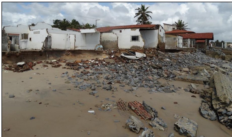
Figura 3. Impactos negativos em construções humanas, decorrentes do avanço do mar, no município de Baía da Traição.

As possibilidades de como é impactado o litoral paraibano ocorre em virtude de ser um grande receptor dos córregos, rios, juntamente com seus afluentes, e periodicamente, também galerias de águas pluviais, os quais são fornecedores de material particulado (como areia e argila). Estes materiais possuem a capacidade de se sedimentar, e onde for depositado, ocupará um lugar, e segundo o “Princípio da Impenetrabilidade”, amparada na Lei do físico e matemático Isaac Newton, dois corpos não ocupam o mesmo lugar no espaço. Nesta situação, a água irá ocupar outro lugar, invadindo locais que favoreçam seu fluxo, o que pode causar impactos negativos em construções artificiais, incluindo ruas e casas (Fig. 3).