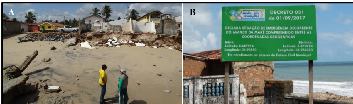
Figura 1. A. Rua Dom Pedro II, na cidade de Baía da Traição-PB, mostrando degradação das residências devido ao avanço do mar; B. e a placa indicatória de interdição da área (Fotos: Luis Gustavo, 2017).

Essa pesquisa objetiva um melhor e maior esclarecimento do problema para tornar mais eficiente, e se possível for, a prevenção e/ou mitigação daquilo que se pode fazer acerca de evitar a degradação. O litoral paraibano faz fronteiras ao norte, com os estados de Rio Grande do Norte e ao sul com o Estado de Pernambuco. Esses assoreamentos têm se agravado nos últimos tempos promovendo situações catastróficas, até degradações. Durante muitos anos a região litorânea do nordeste brasileiro, tem passado por modificações naturais ou provocada pela ação do ser humano, em particular neste caso a do estado da Paraíba, essa tem apresentado características adversas de diversas situações mais ativa e agressiva pela ação desordenada do ser humano. O avanço rápido da evolução do homem e as investidas das águas do mar, e assoreamentos, atribuídos principalmente pelo fenômeno do degelo das áreas glaciais nos últimos tempos (e.g. FIGUEIREDO et al., 2016), têm levado muitos moradores da região próxima ao mar a abandonarem suas residências (Fig. 1).