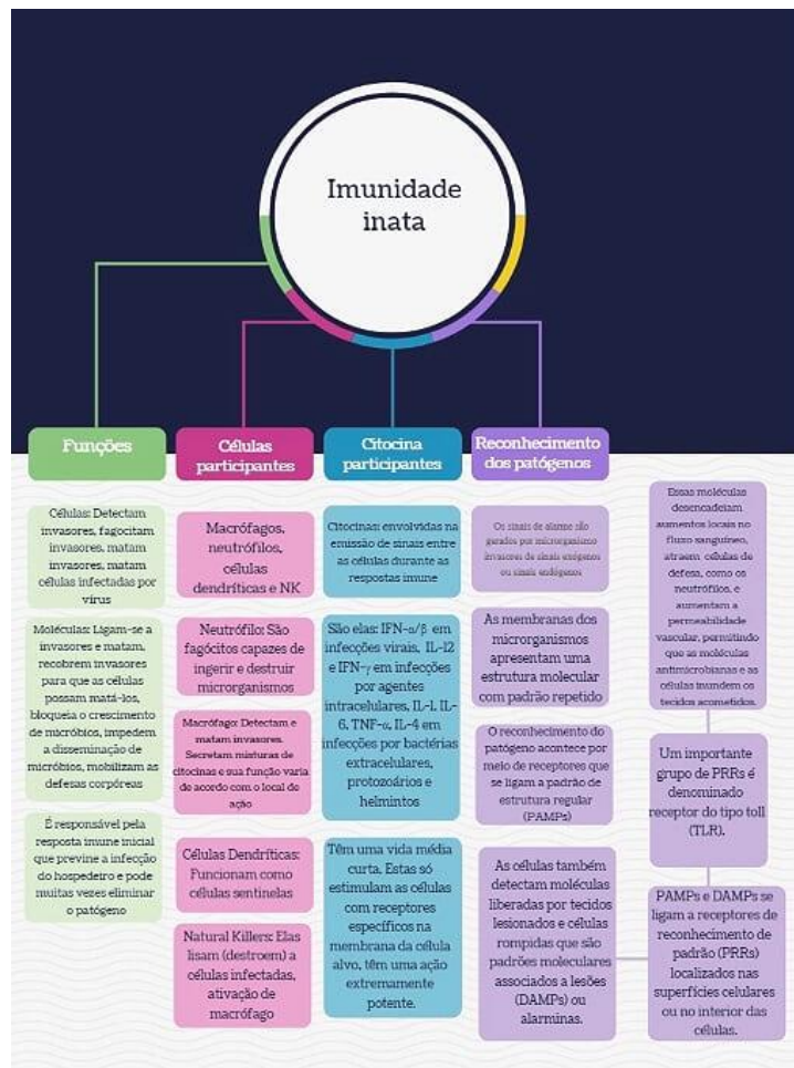
Figura 2. Mapa mental sobre a imunidade inata.

nosso organismo. Estão são compostas pelas células fagocitárias, que são compostas por macrófagos, neutrófilos, células dendríticas e células Natural Killer – NK. Na sequência vem a imunidade adquirida, que é composta pelas células T e células B. As células T são maturadas no Timo. Estas células pertencem a imunidade celular adaptativa. As células B e célula T pertencem a imunidade celular adaptativa que são amadurecidas na medula óssea (CRUVINEL et al., 2010).