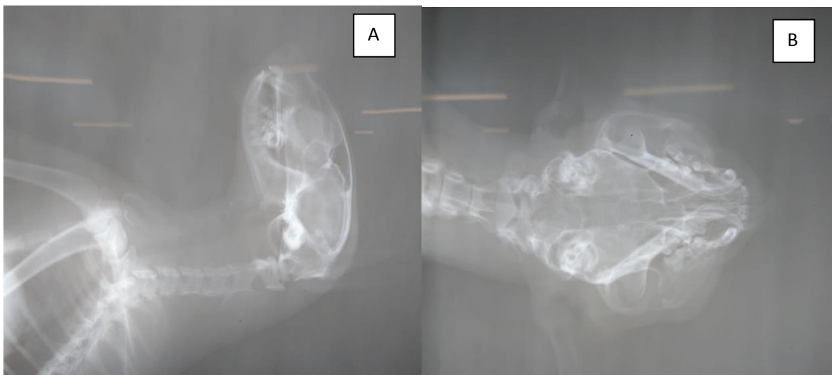
Figura 3. Exame radiográfico do felino em duas projeções. A. decúbito lateral do crânio; B. axial vertice-submento do crânio.

No dia 10 de junho de 2018, o animal passou a ser avaliado a cada 04 horas e o mesmo demonstrou reflexo de deglutição normal, temperatura corporal normalizada, apresentando discreta melhora e assumindo a postura de decúbito ventral; micção normal e controlada. Às 16:00h do mesmo dia, o gato apresentou piora clínica considerável, assumindo a postura de decúbito lateral direito, com contrações mioclônicas involuntárias ipsilaterais, iniciando pela cabeça e se disseminando pelo corpo. Ao ser colocado em posição quadrupedal, apresentava desequilíbrio com tendência para o lado direito, o felino permaneceu venoclisado recebendo fluidoterapia reparadora e de manutenção, com dexametasona na dose de 5mg/kg/q 24h/EV.