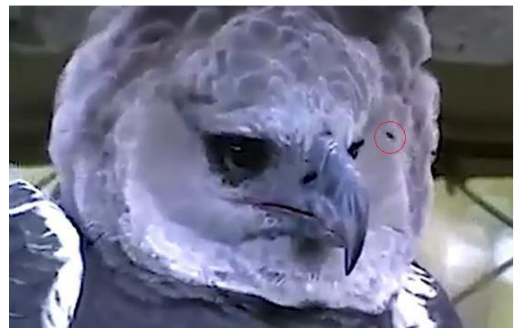
Figura 5. Abelhas ao redor do olho esquerdo e adentrando/saindo narina.