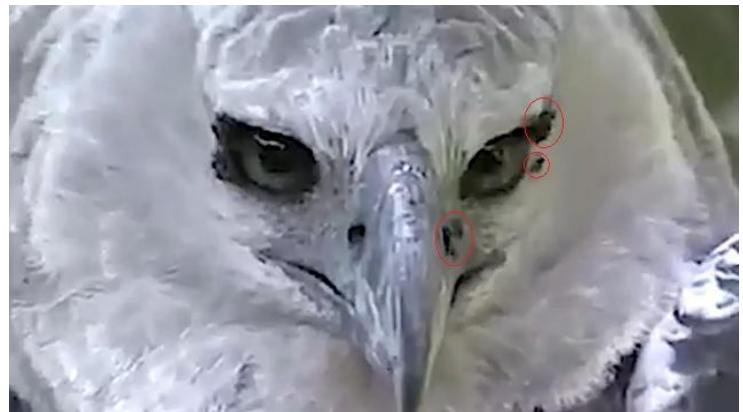
Figura 3. Abelha pairando ao redor da cabeça da Harpia.

Nas seguintes imagens, é possível ver a presença das abelhas na ponta do bico, em seus olhos, em suas narinas e ao redor de sua cabeça (Figuras 3-6).