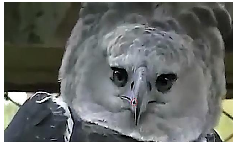
Figura 4. Abelha na ponta do bico da Harpia.