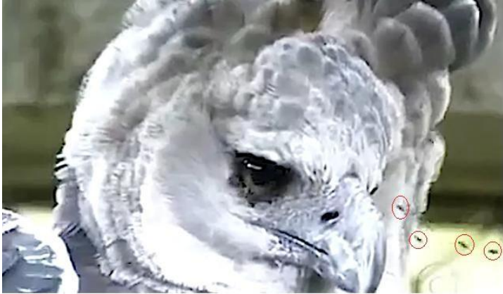
Figura 6. Abelhas pairando ao redor do bico da Harpia.

O material sobre esta relação mutualística ainda é escasso, mas Ivan Sazima conseguiu visualizar aproximações entre Meliponíneos (abelhas sem ferrão) e algumas aves de rapina, sendo elas: dois Gavião-carijó ( Rupornis magnirostris ) adultos, e uma Coruja-buraqueira ( Athene cunicularia ) jovem (SAZIMA, 2015). A relação entre a aproximação das abelhas para com as aves observadas é similar à como foi observado nas Harpias por Lobato et al. (2007), as aves que apresentaram menos agitação receberam as abelhas que por sua vez realizaram a coleta de material nas narinas (SAZIMA, 2015).