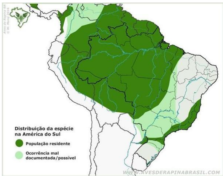
Figura 1. Distribuição da Harpia na América do Sul.

A Harpia já teve uma ocorrência mais notável pela América-do-Sul (Figura 1), porém ao passar dos anos, a atividade antrópica reduziu muito a população destas aves. Hoje, a Harpia ocorre principalmente no Brasil, mais especificamente na Amazônia (Figura 2), pois a região amazônica possui todos os fatores necessários para a sua sobrevivência, apesar da atividade antrópica citada anteriormente. Os mapas a seguir mostram as áreas em que as Harpias que foram avistadas, sendo um destes avistamentos na América do Sul e o outro avistamentos no Brasil (MENQ, 2018; MACIEL, 2025).