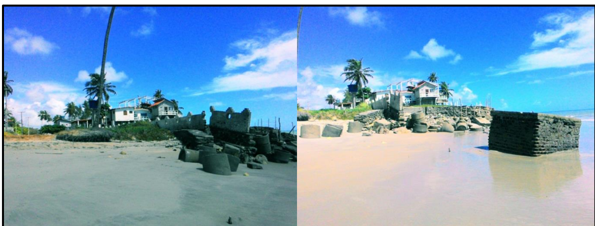
Figura 5. Erosão costeira no município de Pitimbu, litoral sul da Paraíba.

Outra situação mais próxima de nossa realidade foi o que aconteceu na área do estado de Pernambuco, no Porto de Suape, nas instalações das atividades portuárias e industriais, as quais proporcionaram o assoreamento do manguezal do rio Tabatinga, que foi impactado, devido ao aterramento realizado para a pavimentação da Rodovia TDR-Norte, a qual dá acesso ao porto (CIDREIRA, 2014). E esse efeito pode estar ocasionando efeitos diretos ou indiretos na costa paraibana, na cidade de Pitimbu (Fig. 5).